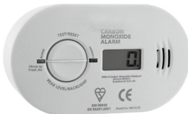
Czujnik dymu i czadu.

Aby zwiększyć swoje bezpieczeństwo, warto zamontować w mieszkaniu czujniki dymu i czadu. Obecnie na rynku są urządzenia, które wykrywają oba te zagrożenia. Ponosimy jednorazowy koszt, ale możemy spać spokojnie. Pamiętajmy – czad jest gazem bezwonny, bezbarwny i silnie trującym, dlatego ujawnia się na dwa sposoby: albo w postaci poważnych objawów zdrowotnych u mieszkańców, albo wykryty właśnie przez czujnik. Niestety, w pierwszym przypadku często może być już za późno na reakcję.